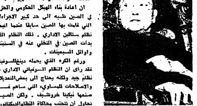
دينغ هسباو بنغ نائب رئيس الوزراء الصيني

والان لن نجد دينغ اية صعوبة في طريق تنفيذ برامجه الاقتصادية والاجتماعية التي بدأ بفضورها مع زملائه منذ وفاة ماوتسي تونغ عام ١٩٧٦ ..